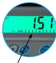
Indicateur de capacité