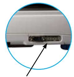
RS-232 bidirectionnelle 1