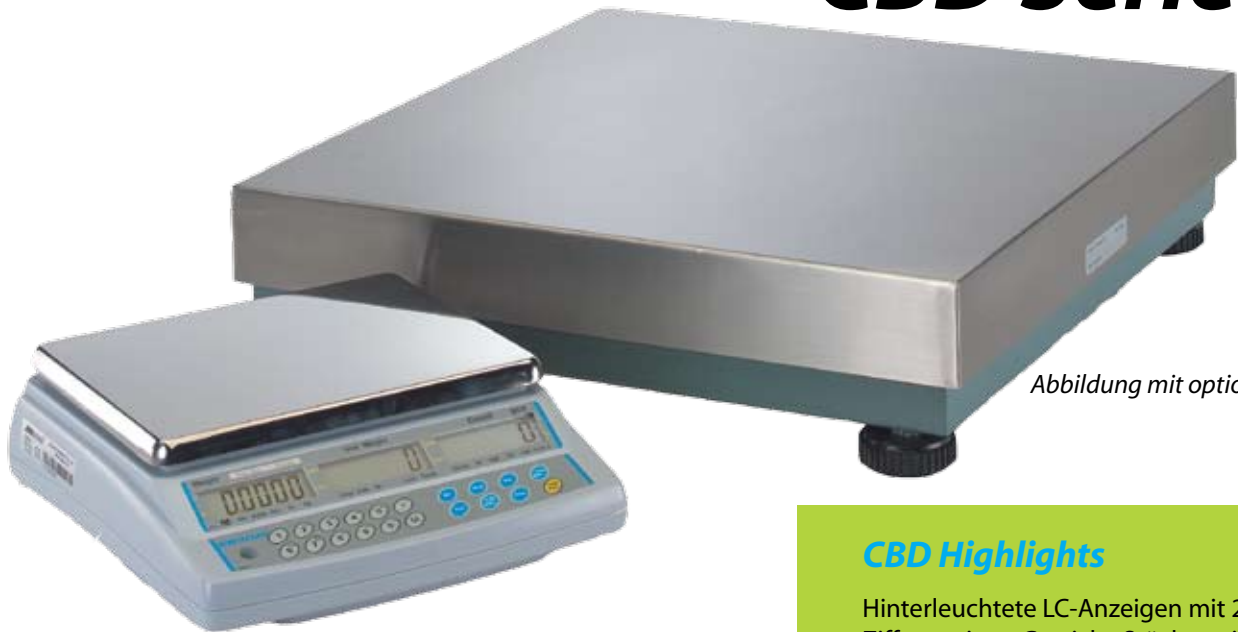
Abbildung mit optionaler Plattform

Die CBD bedeutet leistungsstarke Zählabwicklung mit einer Waage, die leicht zu bedienen und aufzubauen ist.